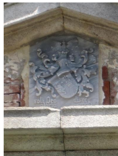
stemma Conti Leonardi di Casalino