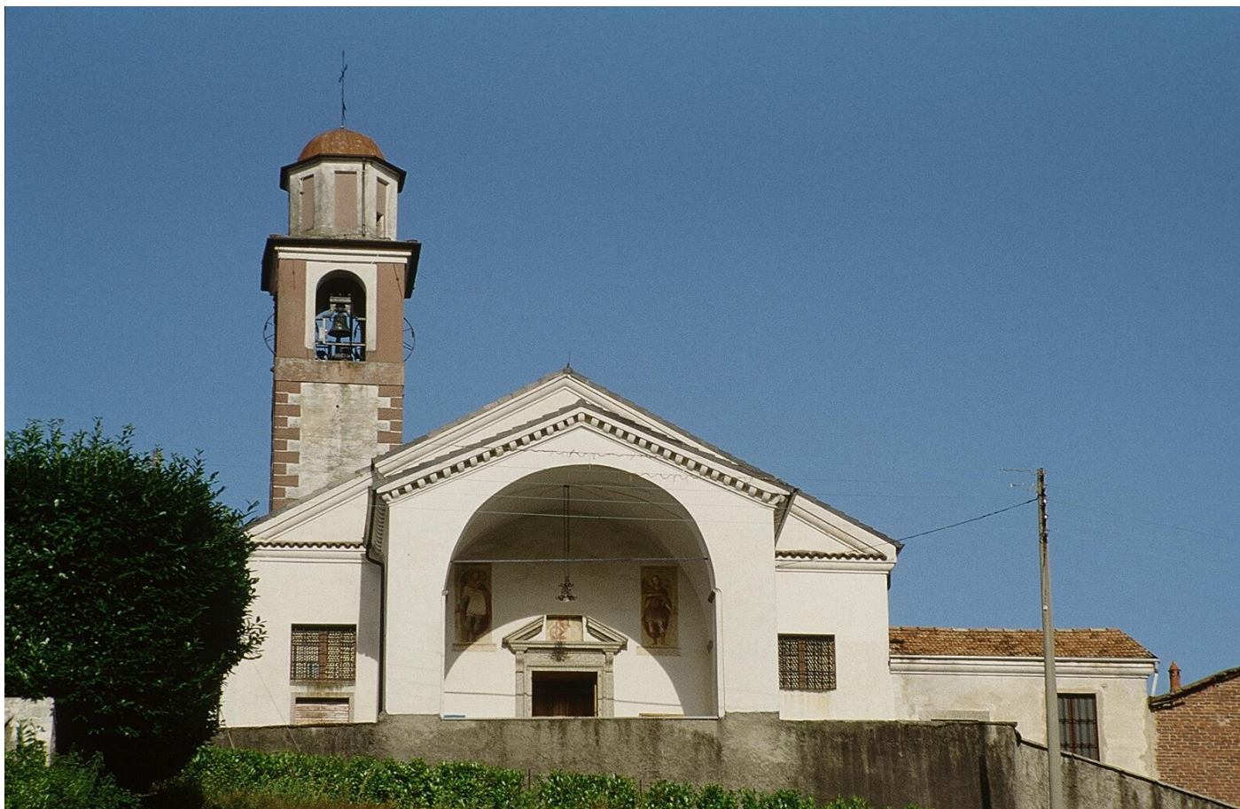
Chiesa parrocchiale di Maggiate Inferiore